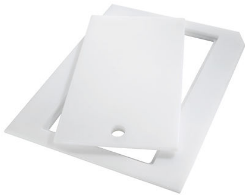
Planche de découpe en HDPE Twin